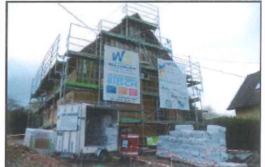
Le Pays du Sundgau propose depuis cette année un service d'aide à la rénovation énergétique des maisons individuelles.

Le Pays du Sundgau a lancé en février sa plateforme d'aide à la rénovation énergétique, Oktave, créée avec l'Agence de l'environnement et de la maîtrise de l'énergie (Ademe) et la Région. Un nouveau service public qui s'appuie sur le regroupement d'artisans locaux pour accompagner les particuliers et proposer des rénovations « clé en main » ainsi que des solutions de financement personnalisées.